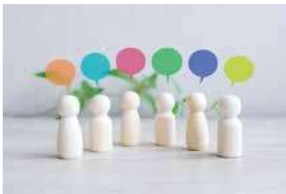
話し合い(イメージ)

一方で、すべての事業で意見聴取を行うことは難しいため、広報誌等を通じて事業の状況を周知し、理解が得られるよう情報発信に努めていきたい。