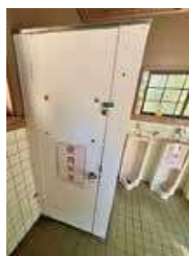
布川男子トイレ