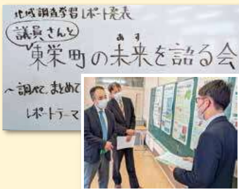
〈授業のテーマと意見交換〉

表してくれました。その内容は、東栄町の魅力やテーマを自ら考え分析し、今後にご生かしていくかという視点から、全国各地の自治体の取り組みについて、その経緯や工夫・アイデアを調べて、東栄町の未来に向けた提言としてまとめたものでした。(詳しくは次号で) 私たち議員にとっても、日ごろ気づけなかった視点や全国の事例として参考になる多くの学びがありました。次の世代を担う生徒の皆さんの発表を、今後のまちづくりにどう生かすか。議会としてもしっかり受け止め、取り組んでいきたいと思えます。