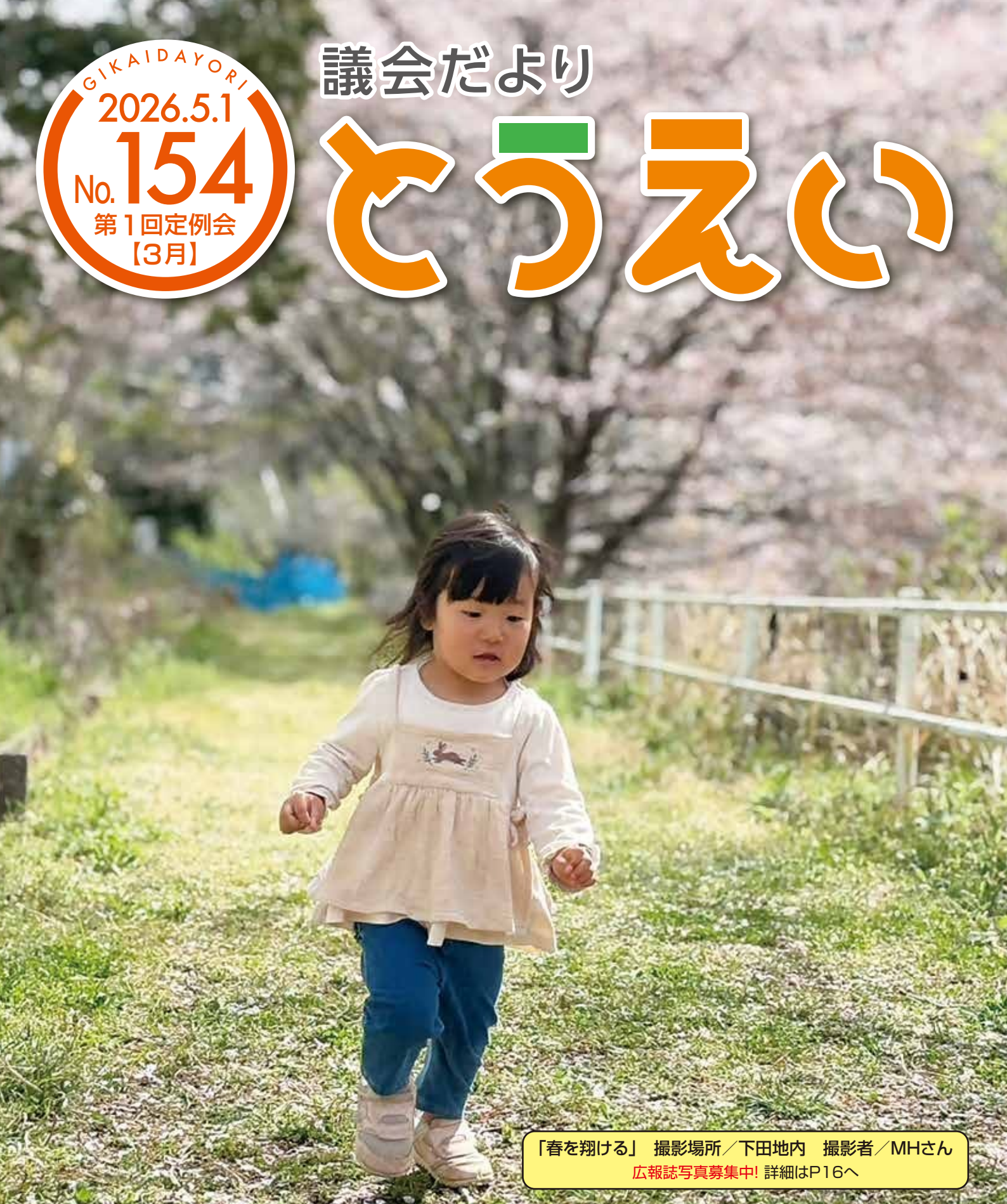
「春を翔ける」 撮影場所／下田地内 広報誌写真募集中! 詳細はP16へ