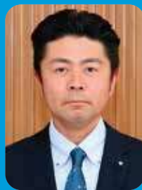
櫻井 孝憲 議員